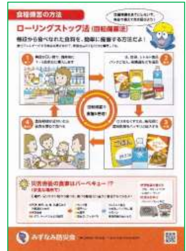
《パンフレットのページ(一部)》

また、最近の非常食は様々なものがあることから、作り方や味を知りたいという意見があり、今回は非常食の試食をしてみようという話になりました。